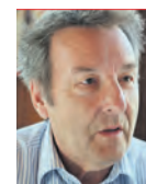
Otto Piller , a. Ständeratspräsident und ehemaliger Direktor des Bundesamts für Sozialversicherungen

Unsere Wirtschaft lebt von sehr vielen Unternehmen, die sich im nationalen und internationalen Wettbewerb bestens behaupten und die Stütze unseres Wohlstandes bilden. Der grösste Teil der Chefs dieser Unternehmen hat stets das wichtigste Ziel vor Augen, nämlich das Unternehmen gesund in die Zukunft zu führen und der Belegschaft die Arbeitsplätze zu sichern. Sie bleiben auch in ihren Lohnbezügen massvoll. Es gibt aber eine Minderheit, die sich schamlos bereichert und ihr Profitdenken über das Wohl des Unternehmens und der Belegschaft stellt. Wir müssen deshalb über eine vernünftige Gesetzgebung diese Minderheit in die Schranken weisen. Dies wird möglich, wenn wir klar ja sagen zur 1:12-Initiative. Wenn wir heute nicht handeln, dürfen wir uns morgen nicht beklagen, wenn die schamlose Abzockerei munter weitergeht.