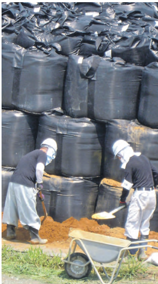
Arbeiten mit verseuchter Erde. Dahinter stapelt sich eine Oberflächendeponie.

abgetragen, in Plastiksäcke abgefüllt und an den Strassenrändern in riesigen Deponien zwischengelagert. Bodenökologe Prof. Satoshi Matsumoto erklärte uns, es sei geplant, diese Säcke in zwanzig Metern Tiefe zu vergraben. Dazu kommt die noch immer schwierige Lage beim AKW selber. Es gibt nur eine improvisierte Notkühlung und täglich werden neue Tanks mit radioaktiv verseuchtem Wasser abgefüllt. Undichte Tanks drohen das Grundwasser zu verseuchen. Diese Beispiele zeigen die Hilflosigkeit der Behörden und welche Erblasten eine solche Katastrophe hinterlässt.