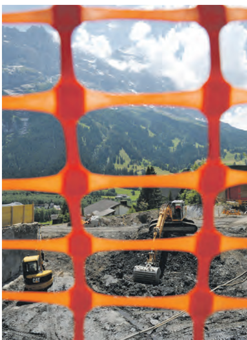
Schluss mit Ausnahmen!

«Das Heulen lohnte sich», kommentierte die Südostschweiz beim Start der Vernehmlassung im vergangenen Juni den Gesetzesentwurf. Neue Zweitwohnungen sind auch bei Überschreitung der 20-Prozent-Grenze erlaubt, z. B. wenn sie auf einer kommerziellen Vertriebsplattform angeboten werden. Die Vermietung der Zweitwohnung an Gäste ist aber schwer zu kontrollieren. Noch schlimmer: Unrentable Hotels können vollumfänglich in Zweitwohnungen umgewandelt werden. Das Hotelsterben wird dadurch regelrecht gefördert, winkt doch ein grosser Profit mit wenig Arbeit. Und zur Frage der Umnutzung von Erst- zu Zweitwohnungen stehen zwei Varianten zur Diskussion: Eine unhaltbare mit totaler Umnutzungsfreiheit und eine vertretbare mit Bewilligungspflicht und klar umschriebenen Bedingungen. Gesamthaft gesehen unterlaufen verschiedene Regelungen direkt die Wirkung des Verfassungsartikels, die 20-Prozent-Klausel.