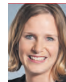
Evi Allemann ist Nationalrätin aus Bern und Mitglied der Sicherheitspolitischen Kommission.

Papierflieger stürzen eher früher als später ab. Mit unserem Referendum helfen wir nach und sorgen dafür, dass der Gripen in der Schweiz nie abhebt. Wir zählen auf deine Unterstützung!