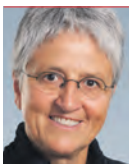
Silva Semadeni ist Nationalrätin aus Graubünden.

Es wird verschwiegen, dass die Umsetzung auch Chancen für den nötigen Innovationschub im Tourismus bietet. Der Baustopp für Zweitwohnungen hat wohl kurzfristig spürbare Konsequenzen für die Bauwirtschaft. Die klassische Tourismusindustrie wird aber gewinnen, mit weniger Siedlungsexpansion und besserer Auslastung der bestehenden Infrastruktur. Gewinnen wird auch die Landschaft, das wahre Kapital des Tourismus. Die verfassungskonforme Ausgestaltung des Zweitwohnungsgesetzes ist möglich und erstrebenswert. Und nur eine konsequente Umsetzung bietet schnell die gewünschte Rechtssicherheit. Dafür setzt sich die SP ein. Ein Referendum wird man dann nicht fürchten müssen.