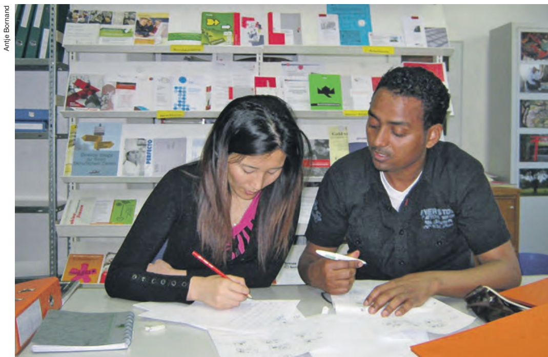
Das SAH Bern unterstützt Erwerbslose bei der beruflichen und sozialen Integration.

Dank Spendengeldern kann das SAH Bern auch innovative eigene Projekte lancieren. So bietet das Buchantiquariat Bücherbergwerk in Bern Vorlehrstellen für junge Erwachsene, die Sozialhilfe beziehen, weil sie den Einstieg in die Berufswelt nach der obligatorischen Schulzeit verpassten. Nach Abschluss einer Vorlehre stehen die Chancen gut, in einer Anschlusslösung einen anerkannten Berufsabschluss zu erlangen. Dies ist für die Betroffenen wegweisend, wenn man bedenkt, dass rund 75 Prozent der jungen Menschen, die Sozialhilfe beziehen, über keinen Berufsabschluss verfügen.