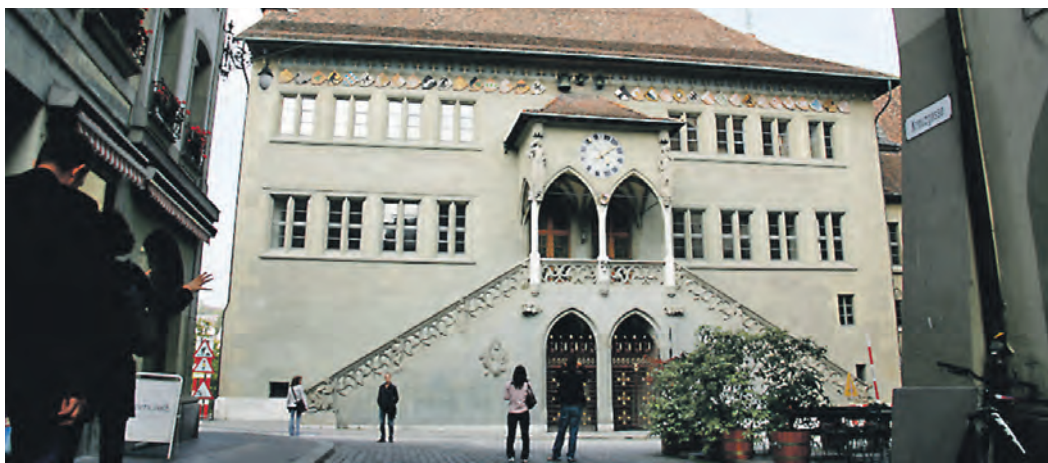
Die Idylle rund um das Berner Rathaus trägt – es weht ein eiskalter Sparwind durchs Kantonsparlament