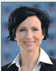
Die Stadt Rheinfelden und Ständerätin Pascale Bruderer Wyss laden ein zum