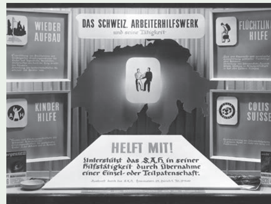
Werbeschaufenster des SAH (1946).

«Der Einsatz für sozial benachteiligte Menschen ist aufgrund der Mehrheitsverhältnisse sowie der klammen Finanzen des Kantons eine tägliche Herausforderung.»