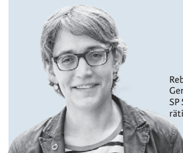
Rebekka Wyler, Co-Generalsekretärin der SP Schweiz und Gemeinderätin in Erstfeld (UR)