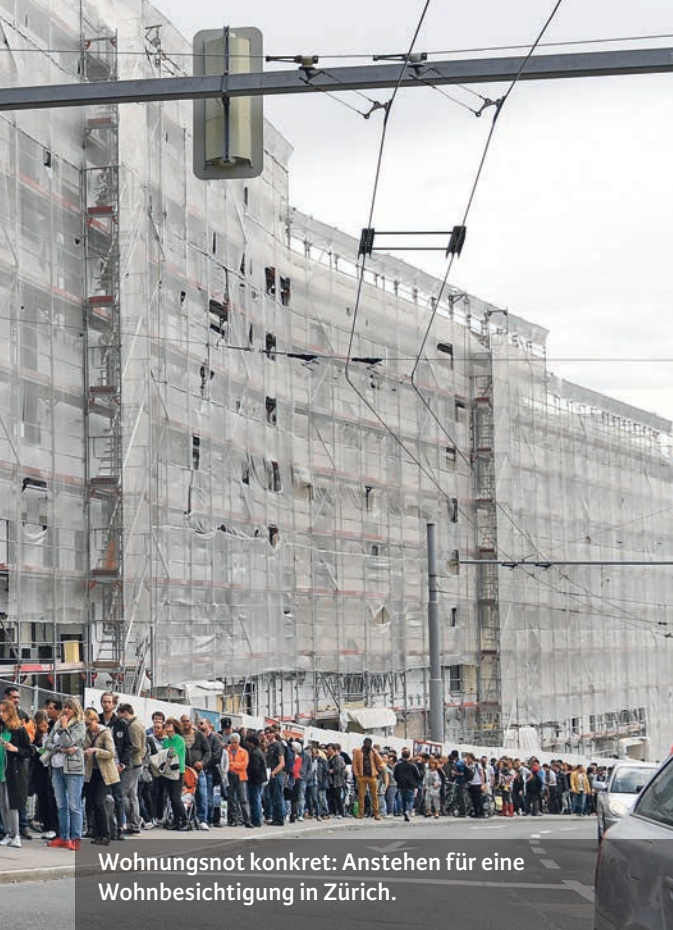
Wohnungsnot konkret: Anstehen für eine Wohnbesichtigung in Zürich.

Darüber hinaus sind tiefe Mieten die beste Altersvorsorge überhaupt. Wer für eine Vierzimmerwohnung statt 2000 1500 Franken bezahlt, spart in einem Arbeitsleben von 40 Jahren – das Ersparte zu einem Prozent Zins angelegt – rund 300 000 Franken an.