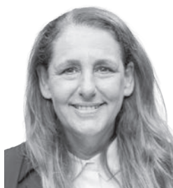
Jacqueline Badran, Nationalrätin ZH

Der Wert aller Liegenschaften in der Schweiz zusammen beträgt über vier Billionen Franken (4000 000 000 000.–). Das sind 4000 Milliarden Franken. Machen wir damit ein Gedankenexperiment: Würden Bund, Kantone und Gemeinden alle Liegenschaften auf einmal aufkaufen und diese Immo-