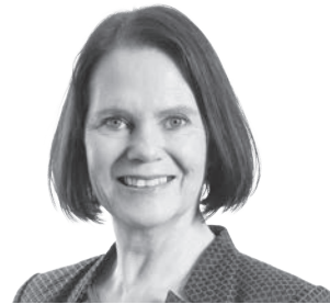
Claudia Friedl, Präsidentin Casafair, Nationalrätin SG

Der Schweizer Wohnungsmarkt steht zunehmend vor einem Paradox: Die Hypothekarzinsen sind rekordtief, die Teuerung praktisch auf Null – und dennoch steigen die Mieten stetig an. Vor allem Menschen mit tieferen Einkommen finden nur mit Mühe eine bezahlbare Wohnung. Sie blättern bis zu 36 Prozent ihres Einkommens für die Miete hin.