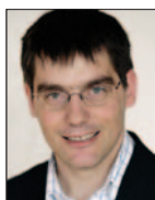
par Roger Nordmann, conseiller national

L'énergie nucléaire présente une caractéristique économique très particulière, à savoir qu'elle nécessite des dépenses considérables après l'arrêt définitif de la production électrique. La déconstruction et la gestion des déchets constituent des coûts très importants. On parle d'ailleurs de courbe de coût en «U» pour exprimer l'idée qu'en plus d'investissements considérables avant le démarrage d'une centrale, il y a des coûts phénoménaux après son arrêt. Cela par opposition à la plupart des énergies renouvelables qui