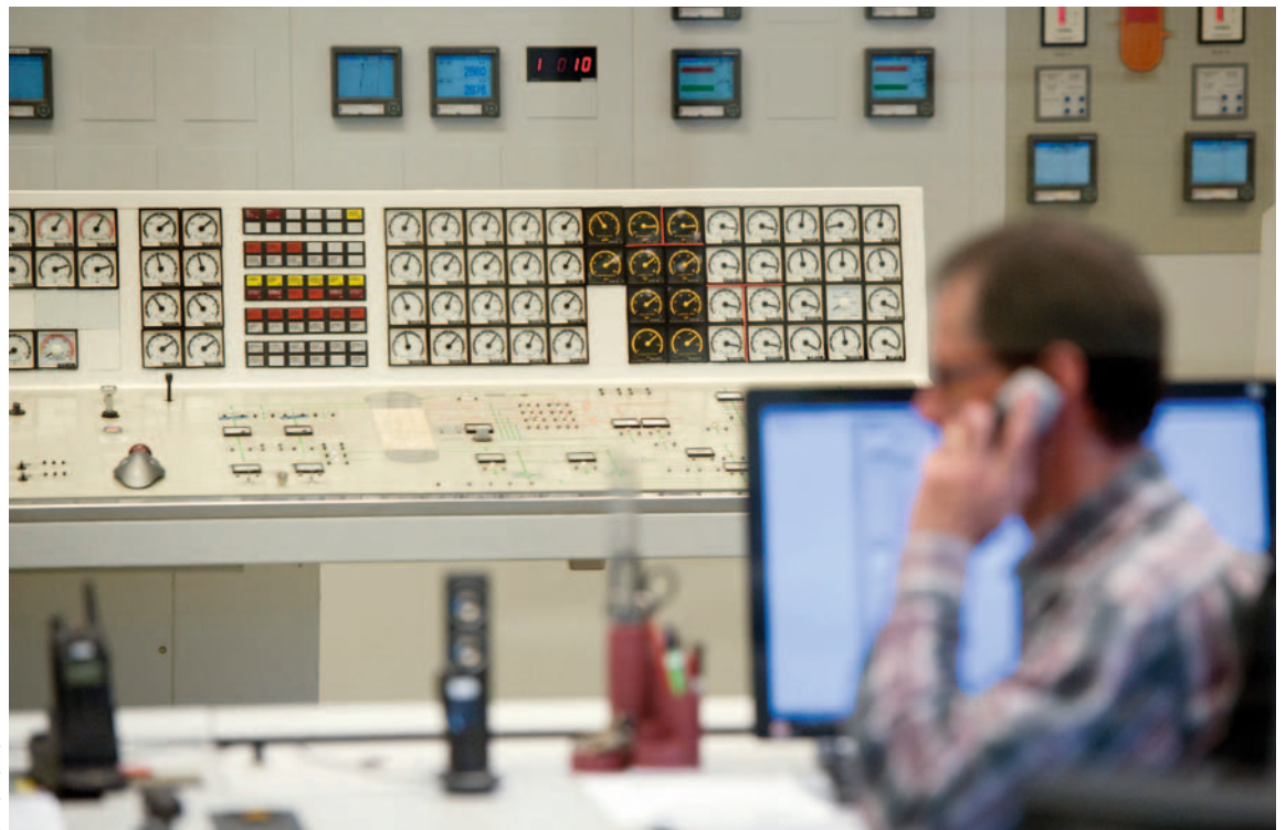
Vue de la salle de commande du réacteur obsolète de Mühleberg. Photo prise le jeudi 17 mars 2011.

La centrale hydroélectrique de Mühleberg (au premier plan) accumule l'eau de l'Aar. La centrale nucléaire (au second plan) en aval est insuffisamment protégée en cas de rupture du barrage.