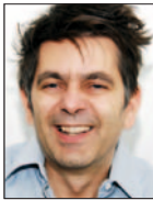
par Matthias Gallati, rédacteur de «PS & énergie»

Par leurs habitudes et leur comportement au quotidien, les habitants déterminent combien ils consomment de chauffage, d'eau chaude et d'électricité. Et ceci s'applique autant aux nouvelles constructions économiques qu'aux bâtiments moins efficaces. Les études ont montré qu'avec un standard de construction identique, avec un même nombre de pièces et une même superficie, la consommation d'énergie peut varier du simple au quadruple!