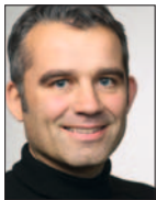
par Beat Jans, conseiller national

Le Conseil national a approuvé le 14 mars 2013 une initiative parlementaire innovante. Celle-ci demande que la taxe du courant au profit des énergies renouvelables soit augmentée, et que l'électricité produite soi-même puisse être à l'avenir déduite de l'électricité consommée. Les entreprises particulièrement intensives en électricité, telle que les fonderies et les recycleurs, seront exemptées du prélèvement RPC. C'est le PS qui est à l'origine de cette initiative.